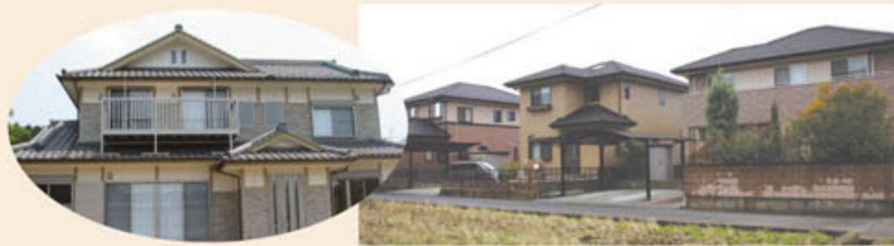
西予市産材4寸桧による次世代省エネ住宅とまちづくり